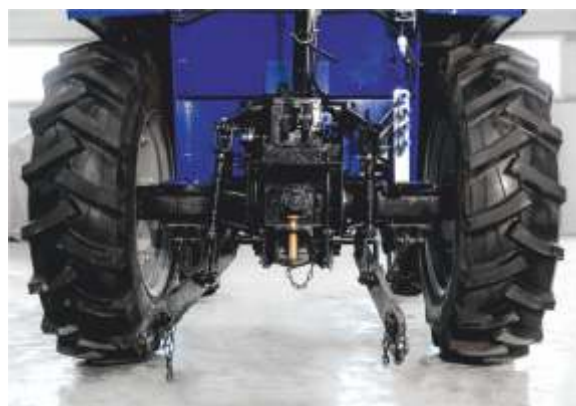
Задняя трехточечная навеска, ВОМ