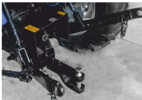
Задняя трехточечная навеска, ВОМ