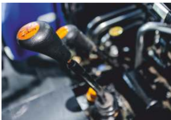
КПП 8x8 с реверсом