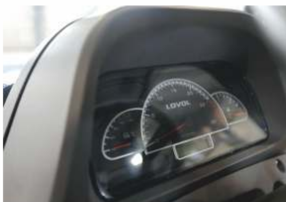
Информативная панель приборов