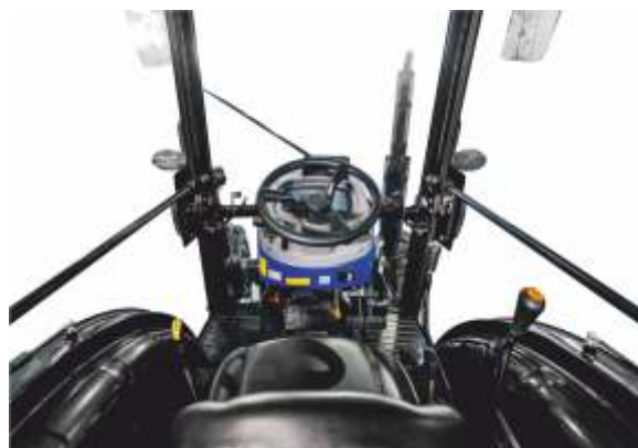
Рычаги управления справа