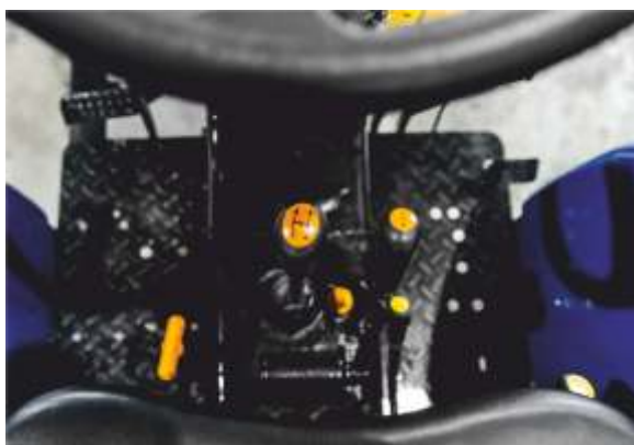
КПП 8x8 с реверсом