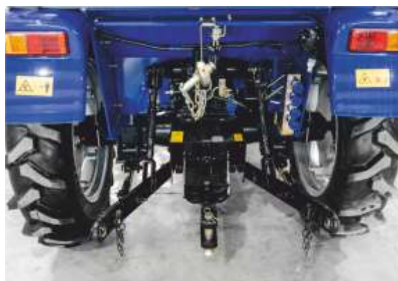
Задняя трехточечная навеска, ВОМ