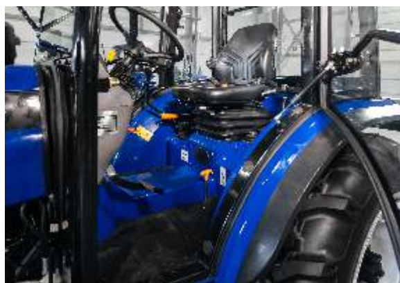
Полностью герметичная кабина, низкий тоннель пола