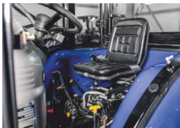
Удобное место оператора

LOVOL TE-244 G2 – имеет практически полное сходство с моделью TE-244HT, за исключением наличия кабины с отопителем, и других параметров, таких как размер шин и количество гидро-выходов. Оснащен трехцилиндровым дизельным двигателем с водяным охлаждением мощностью 24 л.с., имеет полный привод и полноценную тракторную трансмиссию с реверсом, способную выдерживать реальные нагрузки. В базовой комплектации оснащается гидроусилителем руля, блокировкой заднего дифференциала, передними и задними осветительными приборами. Незаменим как в работе на полях, так и при уборке территорий и транспортировке грузов.