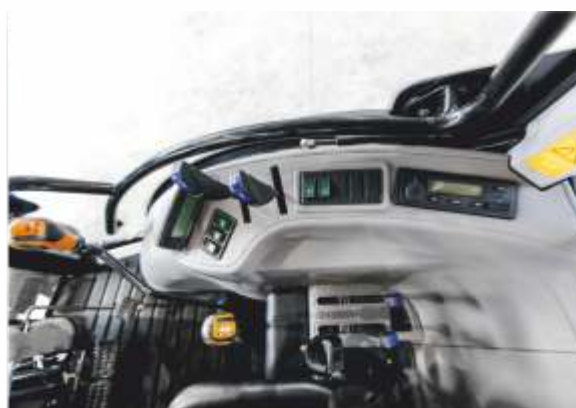
Рычаги управления перенесены направо от оператора