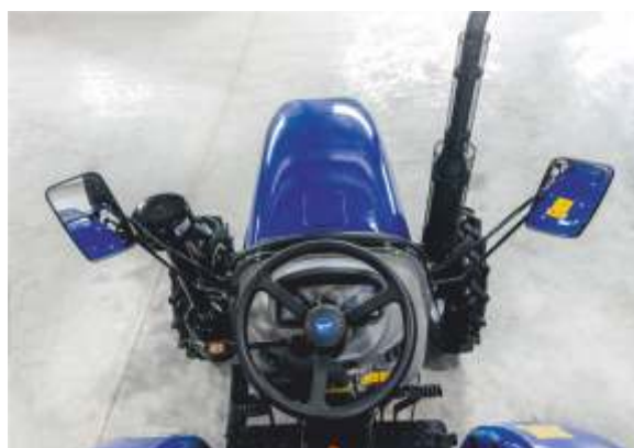
Зеркала заднего вида

LOVOL TE-244HT G2 – самый младший представитель в линейке мини-тракторов LOVOL. Поставляется исключительно без кабины и дуги безопасности. Оснащен трехцилиндровым дизельным двигателем с водяным охлаждением мощностью 24 л.с., имеет полный привод и полноценную тракторную трансмиссию с реверсом, способную выдерживать реальные нагрузки. В базовой комплектации оснащается гидроусилителем руля, блокировкой заднего дифференциала, передними и задними осветительными приборами. Незаменим как в работе на полях, так и при уборке территорий и транспортировке грузов.