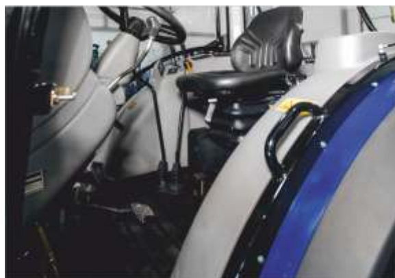
Ровный пол в кабине