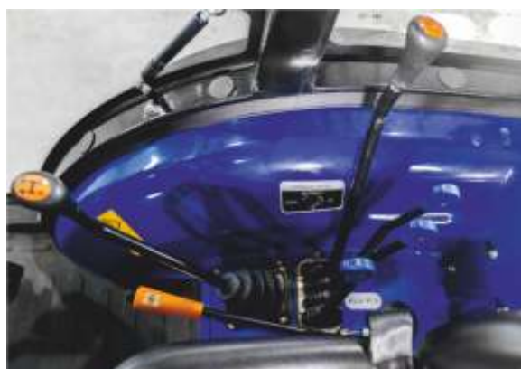
Рычаги управления справа

LOVOL TE-354 G2 – этот трактор оснащается четырехцилиндровым дизельным двигателем с водяным охлаждением мощность 35 л.с., кабиной с отопителем, имеет полный привод и полноценную тракторную трансмиссию с реверсом, способную выдерживать реальные нагрузки. В базовой комплектации оснащается гидроусилителем руля, блокировкой заднего дифференциала, передними и задними осветительными приборами. Имеет все признаки 3-й генерации, кроме нового дизайна. Так же, как и младшие трактора серии TE, применим в сельском и коммунальном хозяйствах не большого размера, подходит для ухода за территориями.