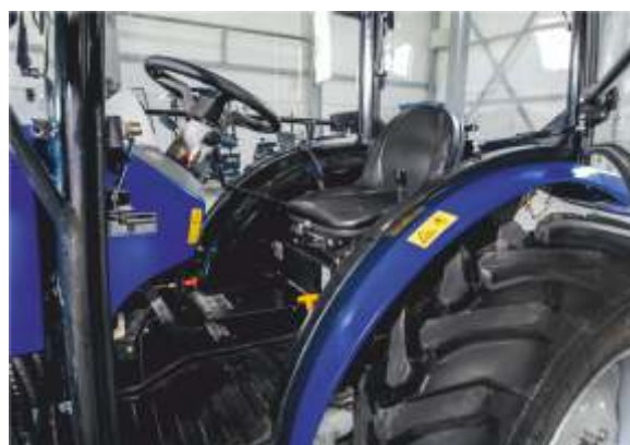
Уменьшенный тоннель пола

LOVOL TE-404 G3 – трактор третьей генерации. Схож по характеристиками с трактором TE-404 G2, за исключением новшеств в дизайне и эргономике кабины. Так же оснащенный четырехцилиндровым дизельным двигателем с водяным охлаждением мощность 40 л.с., кабиной с отопителем, имеет полный привод и полноценную тракторную трансмиссию с реверсом, способную выдерживать реальные нагрузки. В базовой комплектации оснащается гидроусилителем руля, блокировкой заднего дифференциала, передними и задними осветительными приборами, крыльями передних колес. Оборудован двумя гидронасосами. При работе в полях показывает уверенные тяговые характеристики на всех режимах нагрузки.