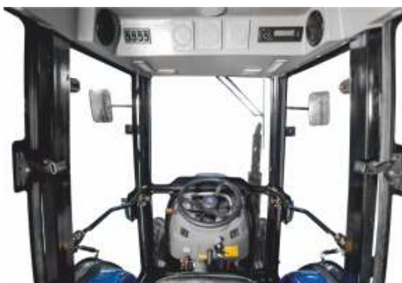
Кабина с центральными боковыми стойками