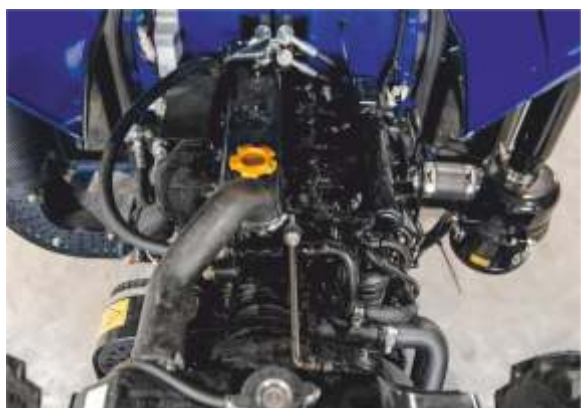
Экономичный 4-х цилиндровый двигатель