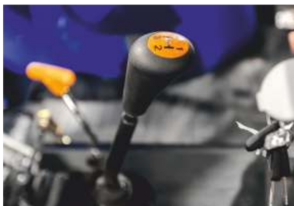
КПП 8x8 с реверсом