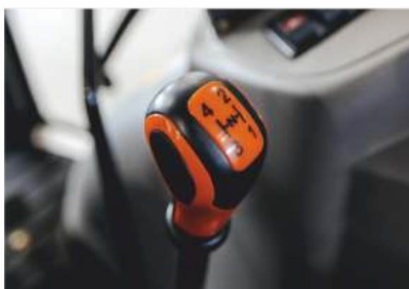
КПП 12x12 с реверсом